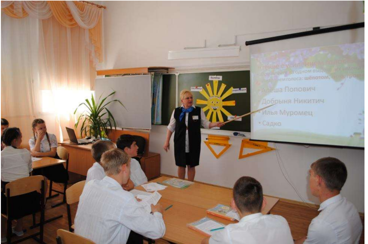
Урок чтения и развития речи 8 класс