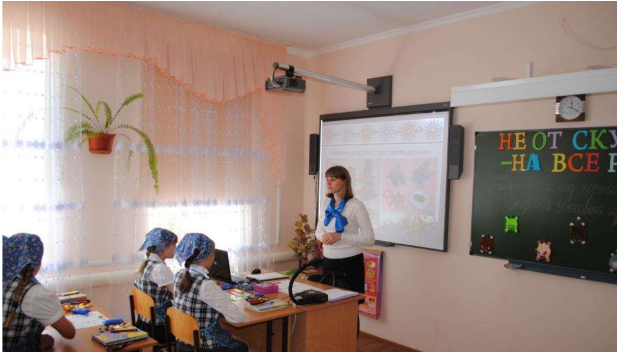
Урок швейного дела 6 класс